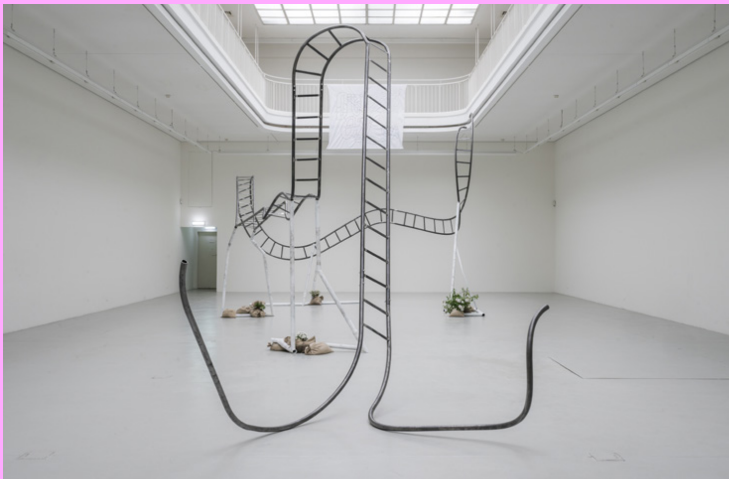
Jesse Darling, Gravity Road , 2020 Acier, sacs de sable, terre, fleurs, bandage élastique, revêtement métallique 470 × 580 × 1,620 cm Courtesy de l'artiste et des galeries Arcadia Missa, Londres et Sultana, Paris