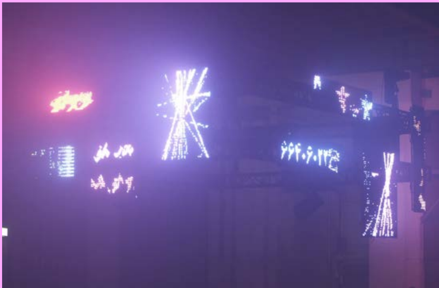
Arash Nassiri, TEEEEHRAN MALEEEEEH MANEEEEH, 2021 Écrans LED, boucles vidéo, enceintes stereo, composition sonore 520 x 620 x 435 cm