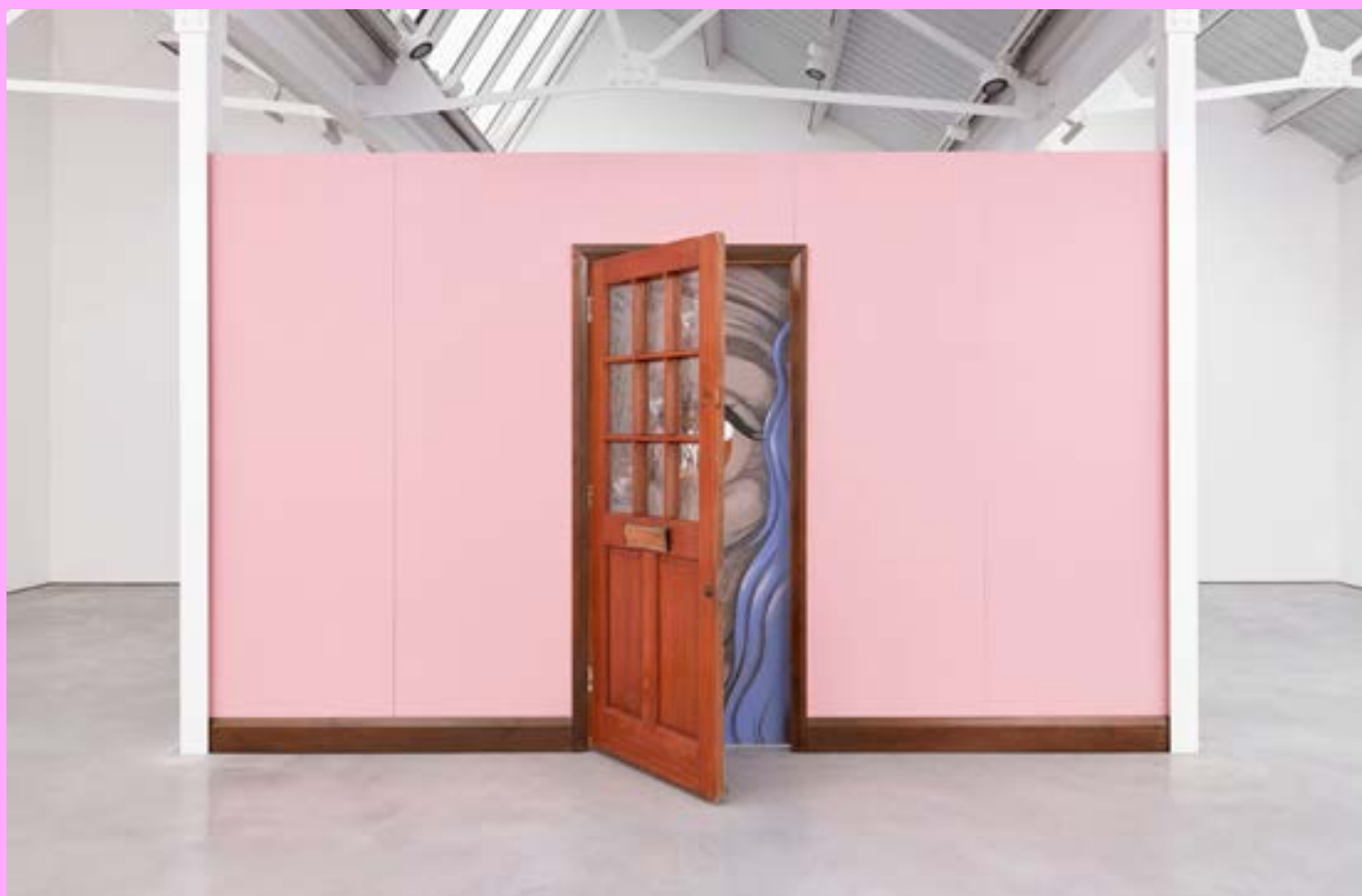
Julien Ceccaldi, Door to Cockaigne , 2022 Acrylique, bois, mdf, porte trouvée 244 x 408 cm