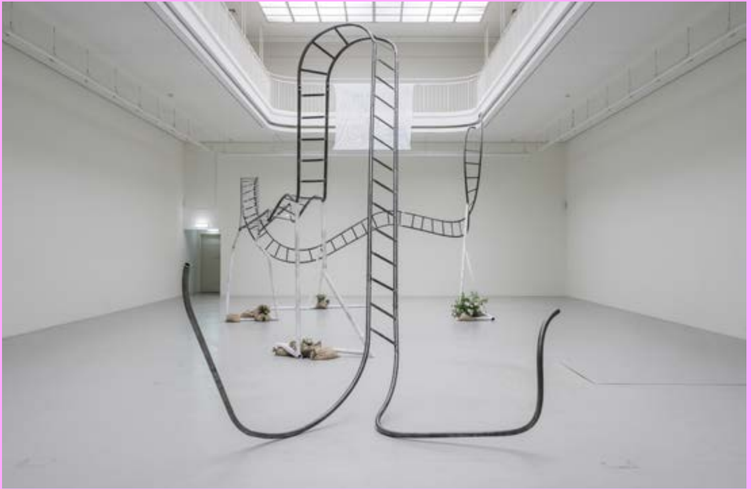
Jesse Darling, Gravity Road , 2020 Acier, sacs de sable, terre, fleurs, bandage élastique, revêtement métallique 470 × 580 × 1,620 cm