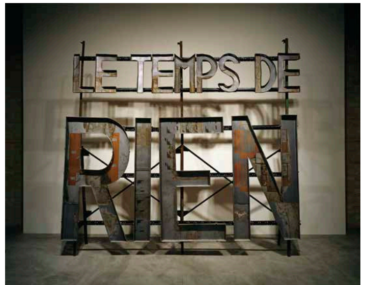
Richard Baquié, Sans titre , 1985. Métal, plaques d'imprimerie offset 310 x 325 x 55 cm. Collection du Capc musée d'art contemporain de Bordeaux.