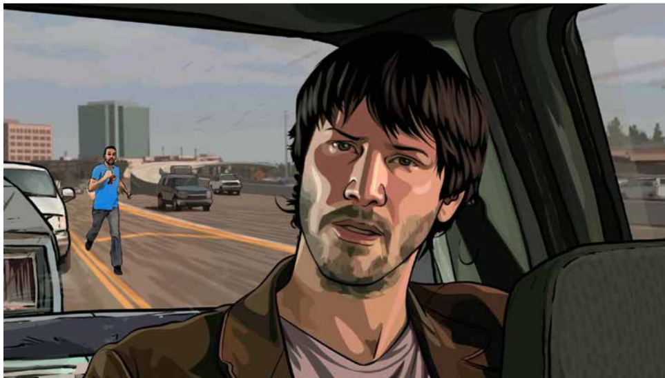
Arnaud Dezoteux, Dark Meta Reeves , 2016. Vidéo HD couleur, son, 28'. Collection du Frac Nouvelle-Aquitaine MÉCA. @DR