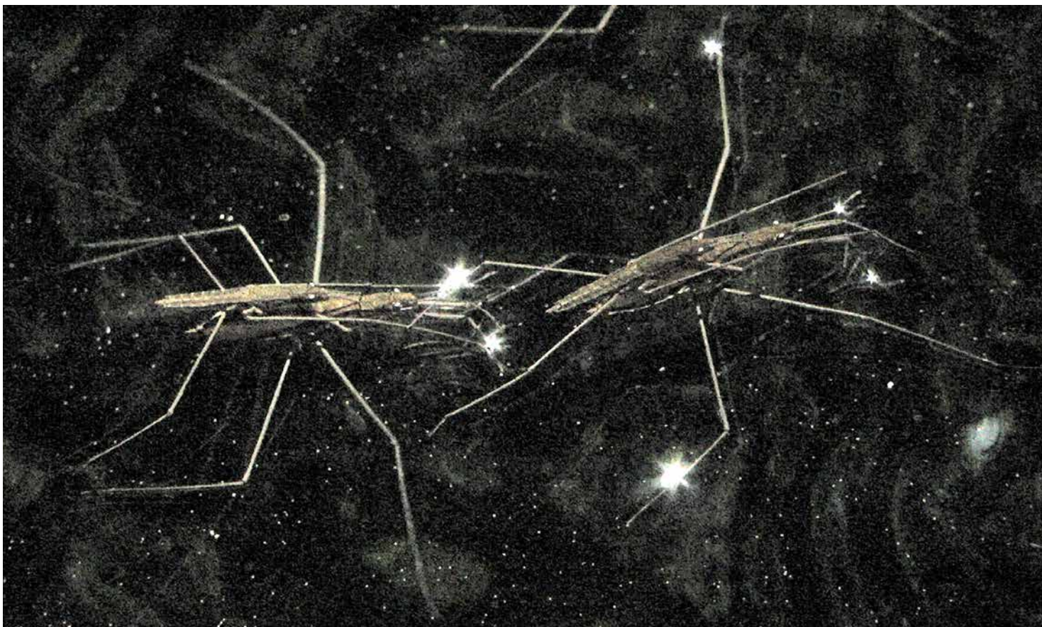
Anne-Charlotte Finel, Gerridae , 2020. Vidéo HD couleur, son, 4'11. Collection du Capc musée d'art contemporain de Bordeaux.