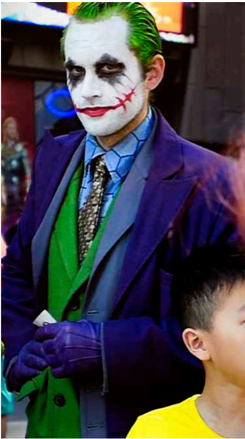
Marie Angeletti, Joker , 2014. Vidéo couleur HD en boucle, muet, 1'13. Collection du Frac Nouvelle-Aquitaine MÉCA. ©Marie Angeletti.