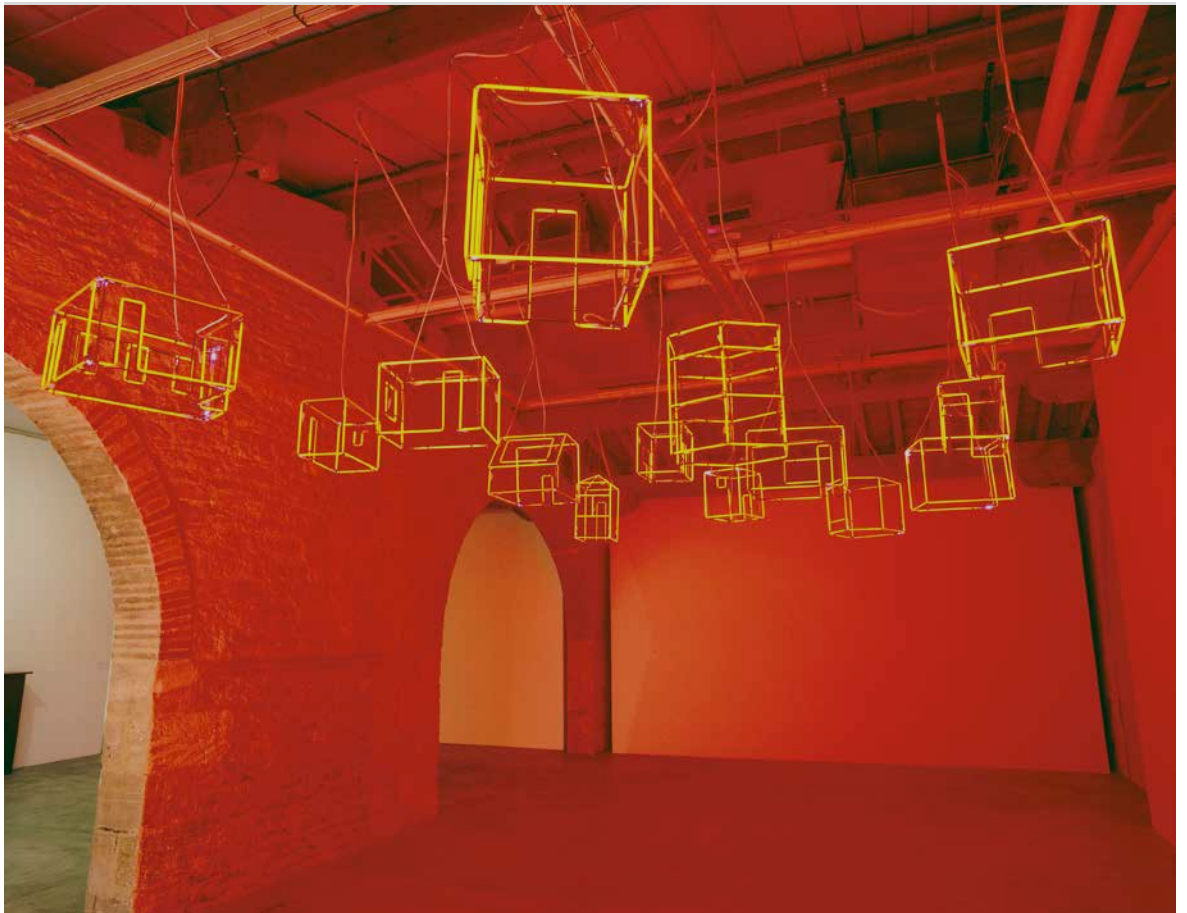
Sarkis, 14 lustres des Ateliers Brulés de Sarkis depuis 1956 , 1999/2000. Installation. Néon en cristal. Collection du Capc musée d'art contemporain de Bordeaux.