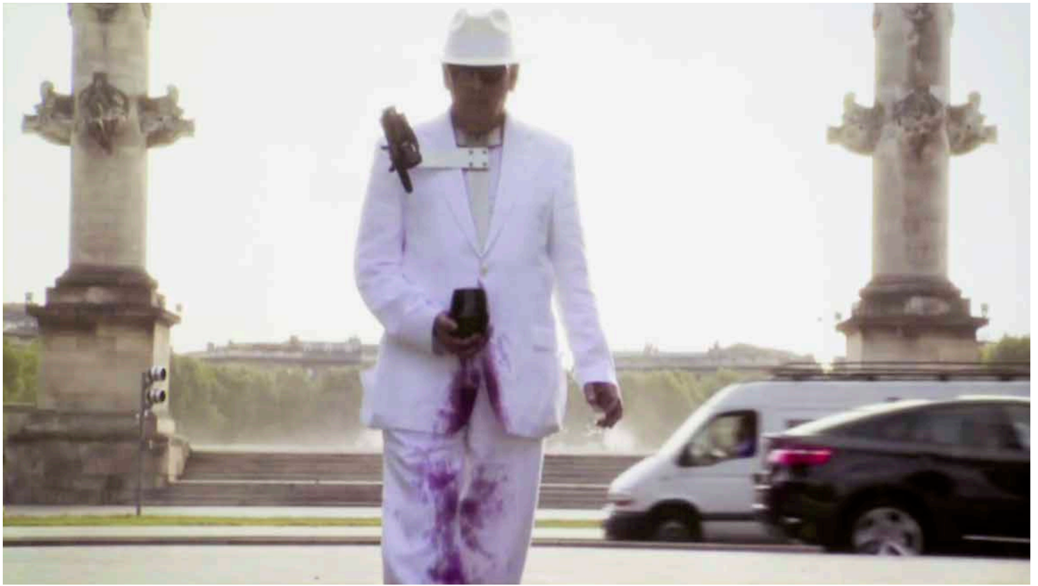
Dennis Adams, Spill , 2009. Vidéo HD couleur, son, 42'. Collection du Frac Nouvelle-Aquitaine MÉCA. ©Dennis Adams.