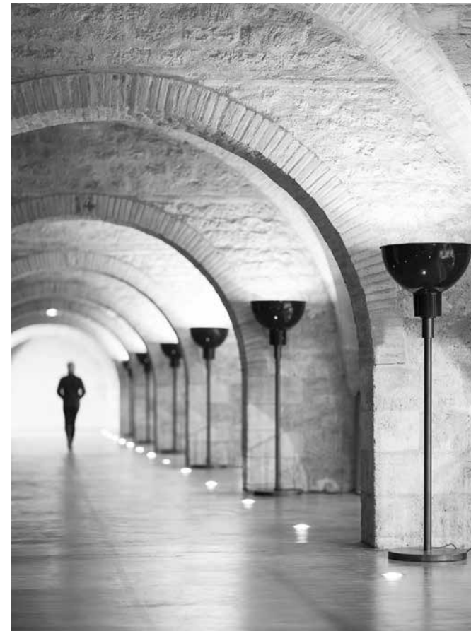
Lampadaire, 1990 Andrée Putman/ECART Mezzanine du CAPC musée d'art contemporain de Bordeaux Photo : Arthur Péquin, 2015

Entrée libre, dans la limite des places disponibles