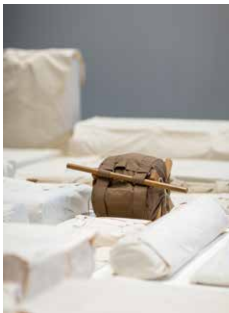
1. Werksatz (Première série d'œuvres), 1963-69 (détail). Collection The Franz Erhard Walther Foundation. Exposition Franz Erhard Walther, Le Corps décide / The Body Decides, CAPC musée d'art contemporain, 2014-2015.