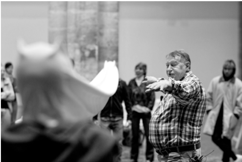
Copie d'exposition (2011-2014) 1. Werksatz (Première série d'œuvres) , 1963-69. Collection The Franz Erhard Walther Foundation

Activation avec les étudiants du Conservatoire de Bordeaux – Jacques Thibaud et de l'École d'Enseignement Supérieur d'Art de Bordeaux – EBABX Exposition Franz Erhard Walther, Le Corps décide / The Body Decides, CAPC musée d'art contemporain, 2014-2015.