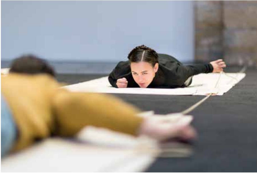
Activation avec les étudiants du Conservatoire de Bordeaux – Jacques Thibaud et de l'École d'Enseignement Supérieur d'Art de Bordeaux – EBABX Exposition Franz Erhard Walther, Le Corps décide / The Body Decides, CAPC musée d'art contemporain, 2014-2015.