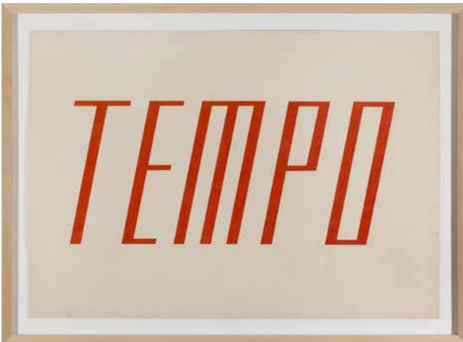
Franz Erhard Walther, Wortbild TEMPO (Image mot «TEMPO»), 1958. Collection privée, Londres

Vue de l'exposition Franz Erhard Walther, Le Corps décide / The Body Decides , CAPC musée d'art contemporain de Bordeaux, nov. 2014 – mars 2015.