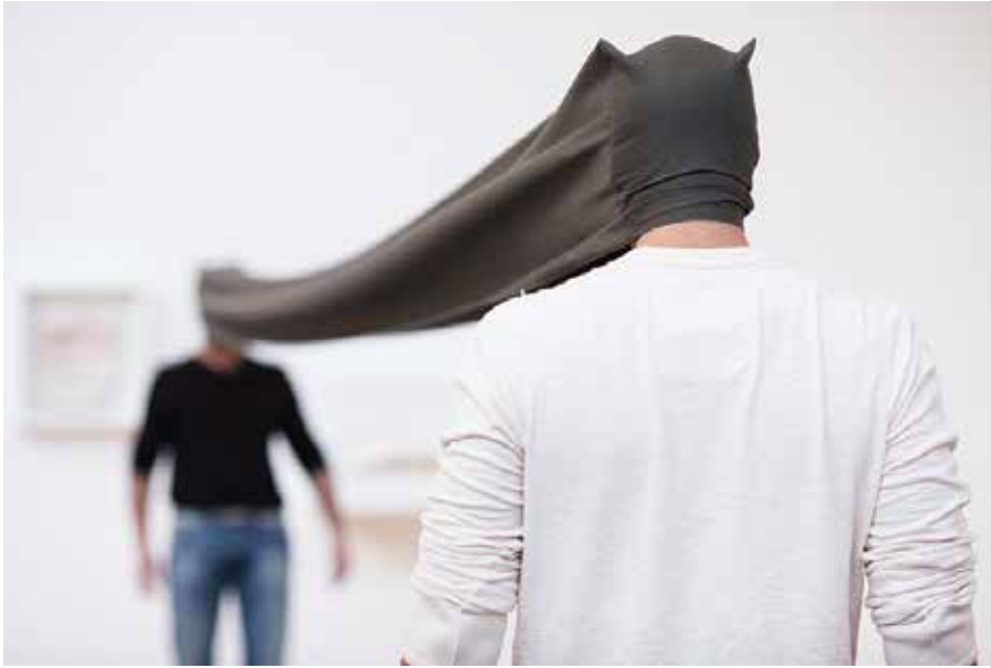
Franz Erhard Walther, Sehkanal (First Work Set, element # 46) , 1968. Vue de l'exposition Dia:Beacon , Riggio Galleries, Beacon, 2011.