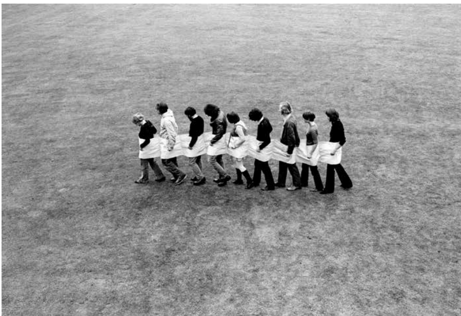
Franz Erhard Walther, Kurz vor der Dämmerung (Short Before Twilight [First Work Set, element # 32]) , 1967.