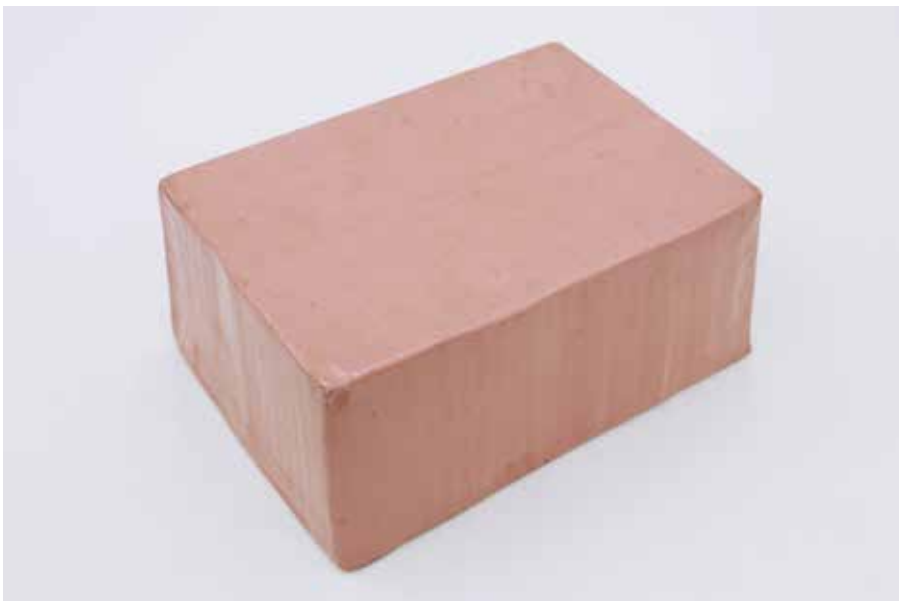
Franz Erhard Walther, Versiegelter rosa Lackkarton , 1963

D'autres visuels disponibles disponibles en téléchargement sur Dropbox :