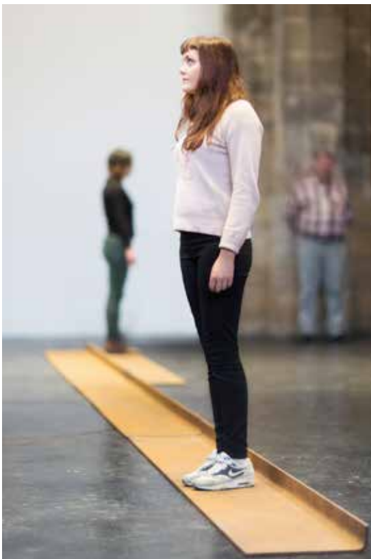
Copie d'exposition (2011-2014) 1. Werksatz (Première série d'oeuvres) , 1963-69. Collection The Franz Erhard Walther Foundation