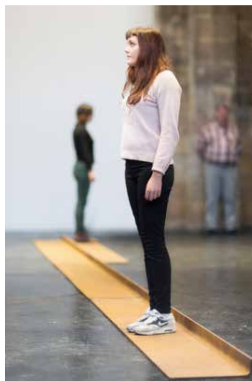
Metallarbeit / Strecke und halbe Strecke. Zwei Richtungen (Travail des métaux / Route et demi route. Deux directions), 1977. Courtesy KOW, Berlin Exposition Franz Erhard Walther, Le Corps décide / The Body Decides, CAPC musée d'art contemporain, 2014-2015.