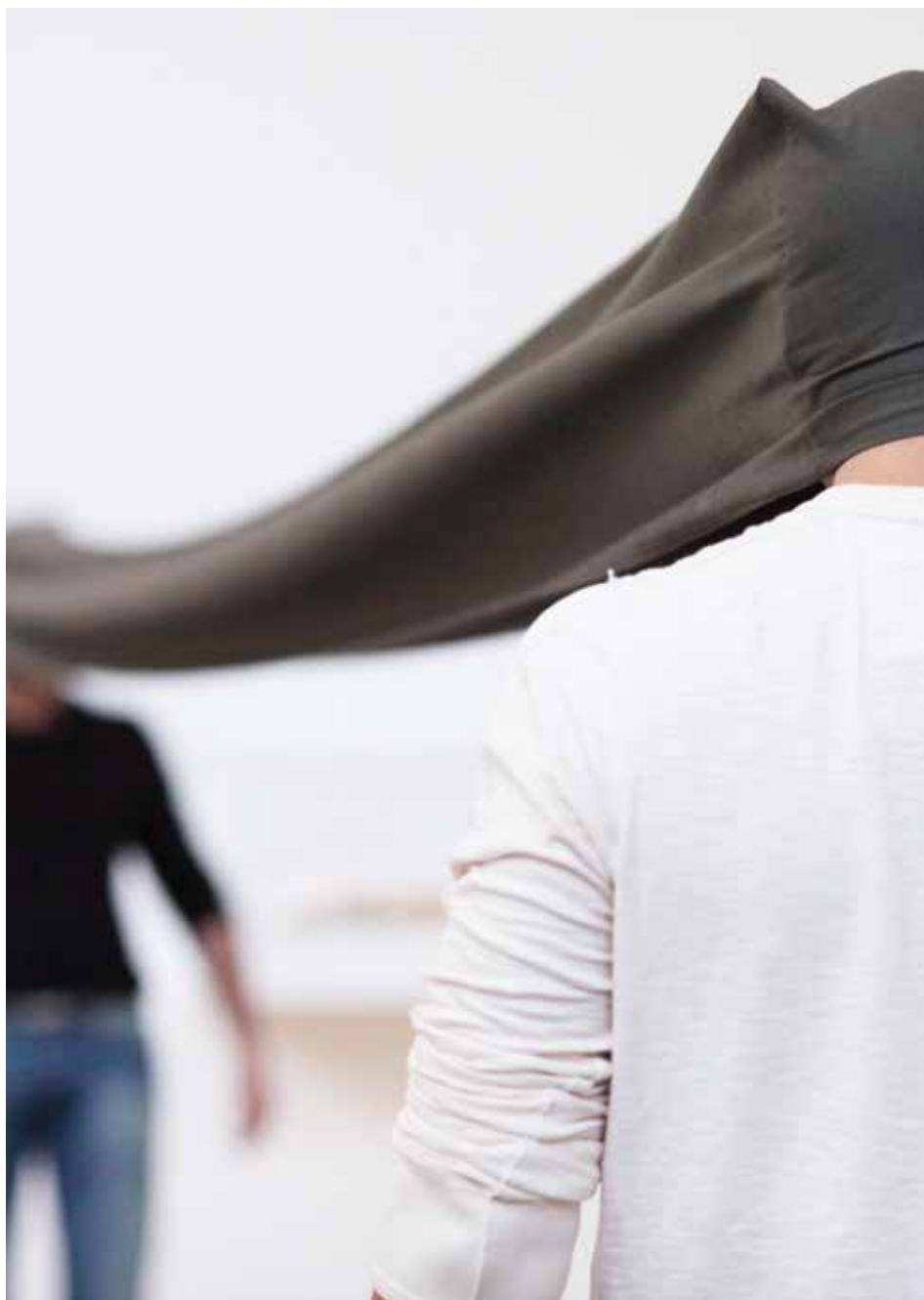
Franz Erhard Walther, Sehkanal (First Work Set, element # 46) , 1968. Courtesy The Franz Erhard Walther Foundation et Dia Art Foundation, New York. Photo : Paula Court, 2011

CAPC musée d'art contemporain de Bordeaux