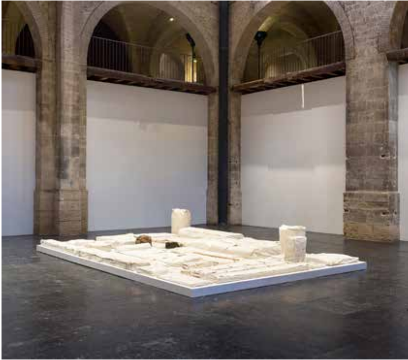
1. Werksatz (Première série d'œuvres) , 1963-69 Collection The Franz Erhard Walther Foundation.

Activation avec les étudiants du Conservatoire de Bordeaux – Jacques Thibaud et de l'École d'Enseignement Supérieur d'Art de Bordeaux – EBABX Exposition Franz Erhard Walther, Le Corps décide / The Body Decides , CAPC musée d'art contemporain, 2014-2015.