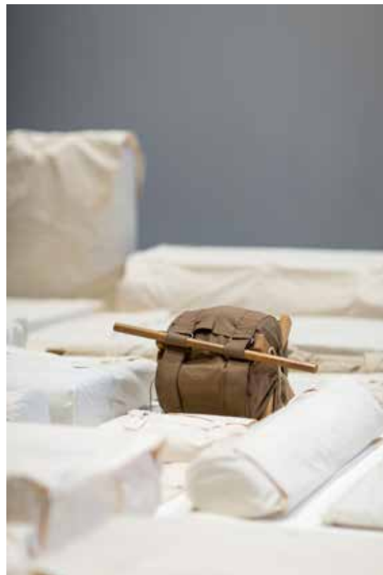
Metallarbeit / Strecke und halbe Strecke. Zwei Richtungen (Travail des métaux / Route et demi route. Deux directions) , 1977.