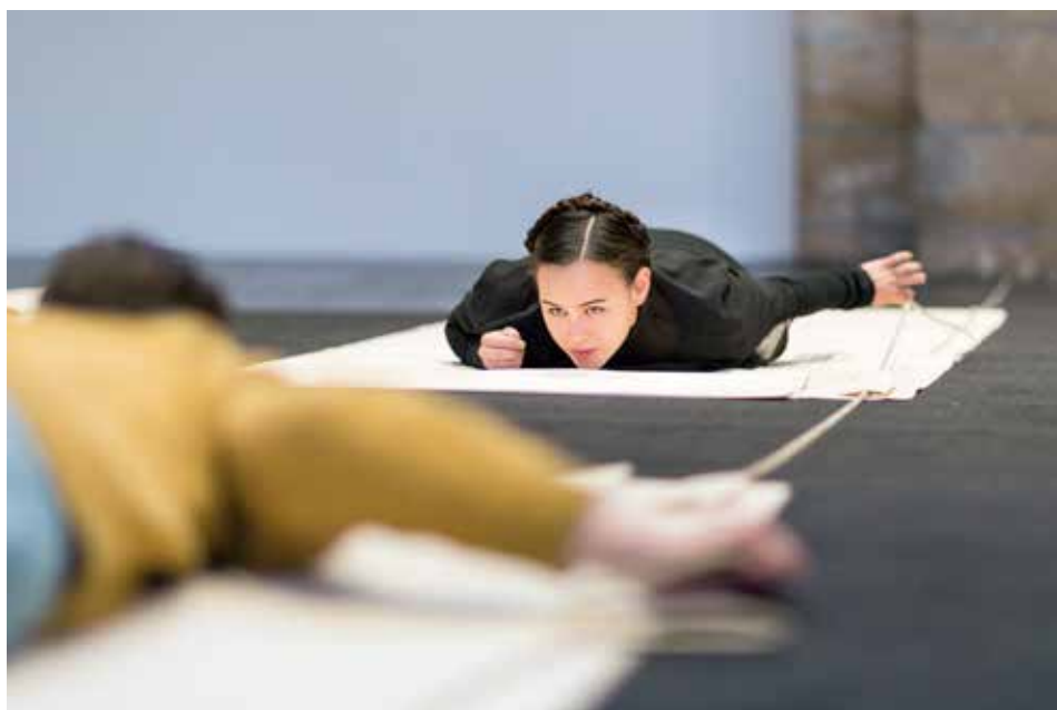
1. Werkstanz (Première série d'œuvres), 1963-69. Copie d'exposition (2011-2014)