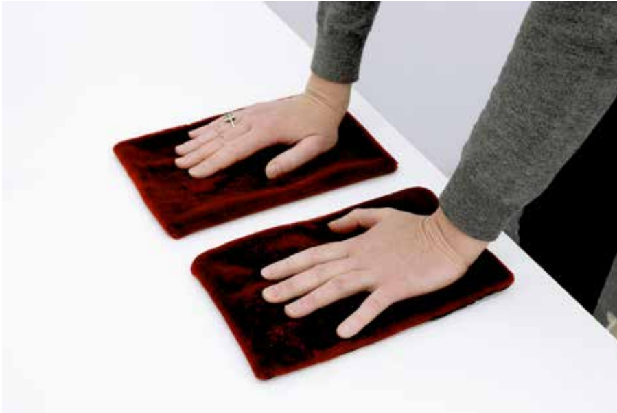
Franz Erhard Walther, Zwei rotbraune Samtkissen (gefüllt und leer) (Two Reddish Brown Velvet Cushions [Filled and empty]) , 1963.