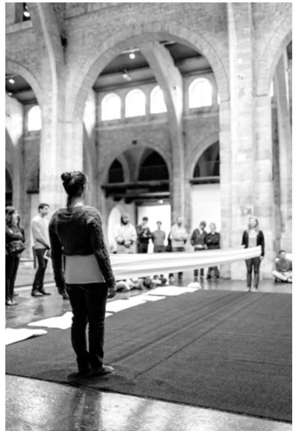
Copie d'exposition (2011-2014) 1. Werksatz (Première série d'œuvres) , 1963-69. Collection The Franz Erhard Walther Foundation