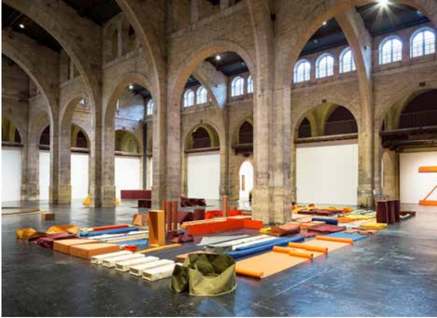
Franz Erhard Walther, Lager der Probenähungen (Stock des premières œuvres cousues), depuis 1969. Collection The Franz Erhard Walther Foundation.

Vue de l'exposition Franz Erhard Walther, Le Corps décide / The Body Decides , CAPC musée d'art contemporain de Bordeaux, nov. 2014 – mars 2015.