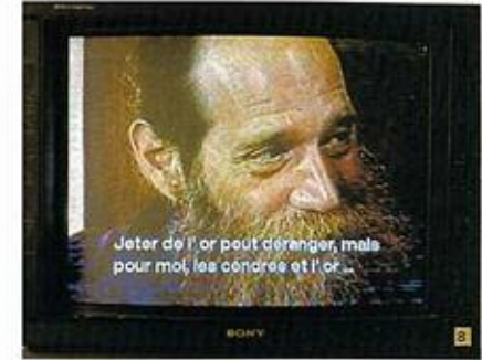
Lawrence Weiner, QUELQUES CHOSES... , 1991, capcMusée d'art contemporain de Bordeaux.