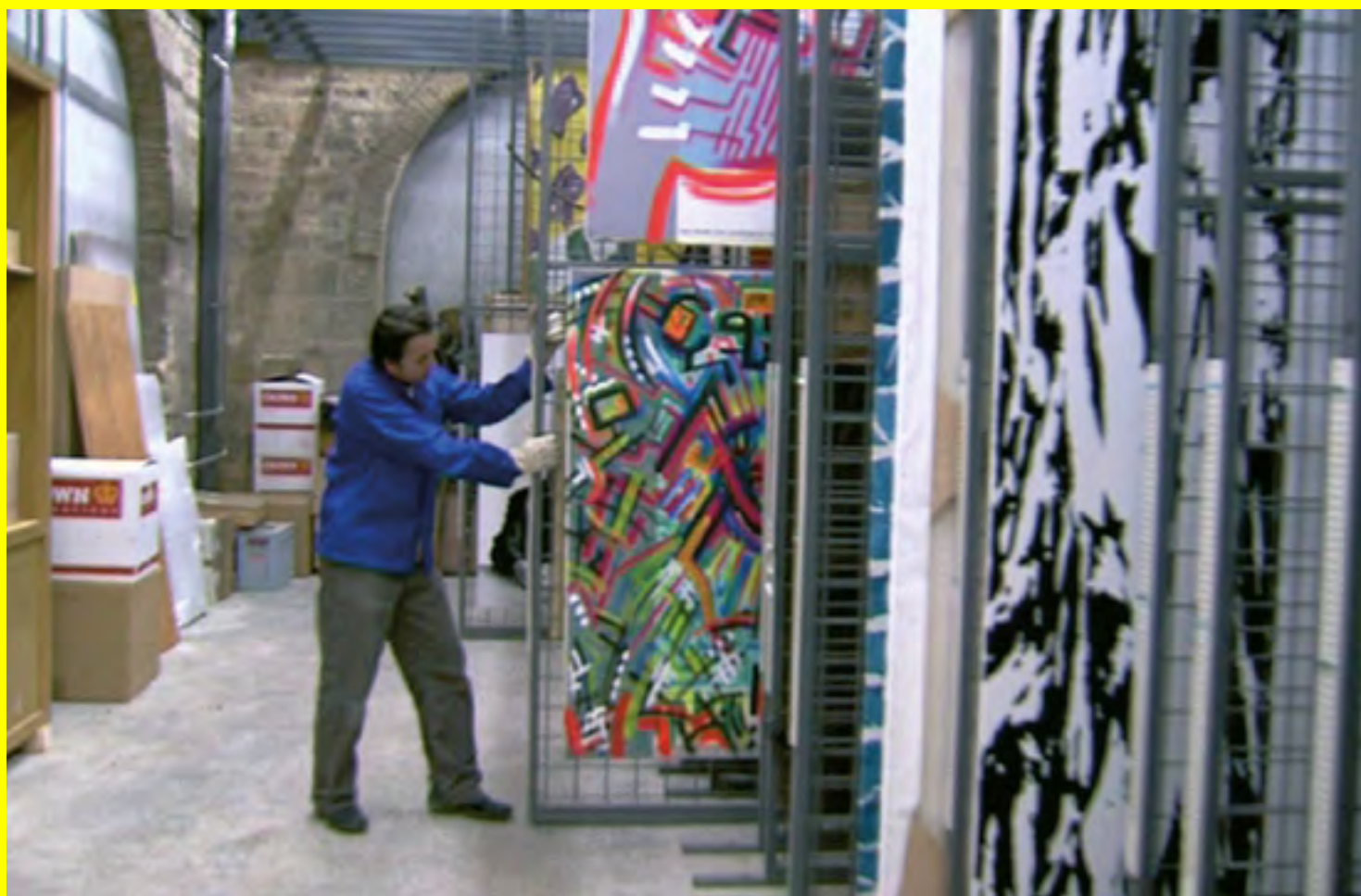
Alicia Framis, Grève Secrète/capcMusée Bordeaux 2005, 2005 Master vidéo DVD-R. Durée : 8'28. Tirage : 1/5 Collection Capc Musée d'art contemporain de Bordeaux.