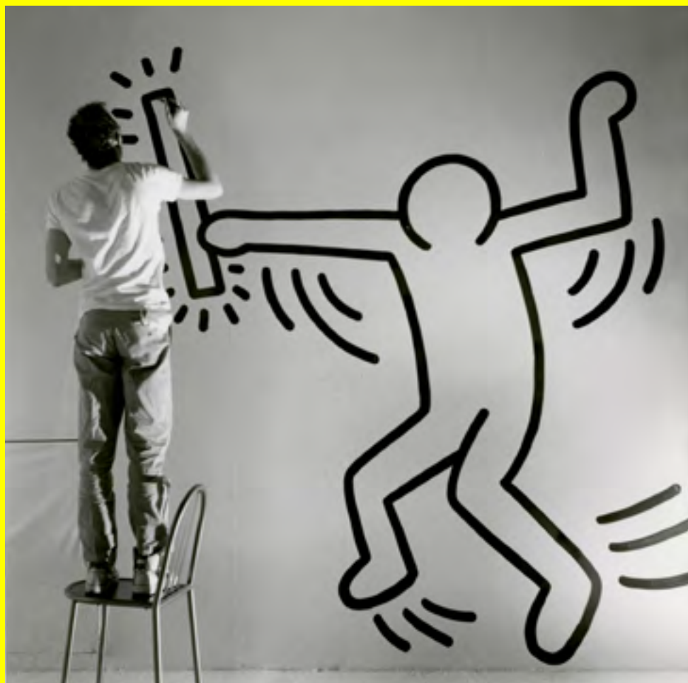
Keith Haring durant le montage de son exposition au Capc Musée, 1985