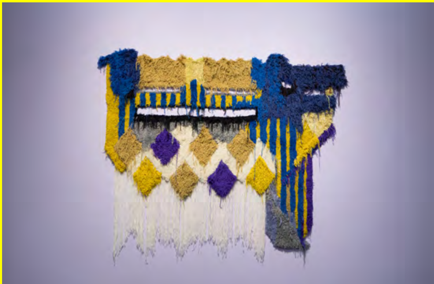
Caroline Achaintre, Hocus locus , 2018 Laine tuftée à la main. 325 x 273 cm Collection Capc Musée d'art contemporain de Bordeaux