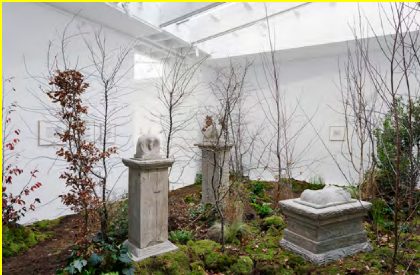
Laurent Le Deunff, The Mystery of Sculpting Cats , 2020 © Adagp, Paris, 2021