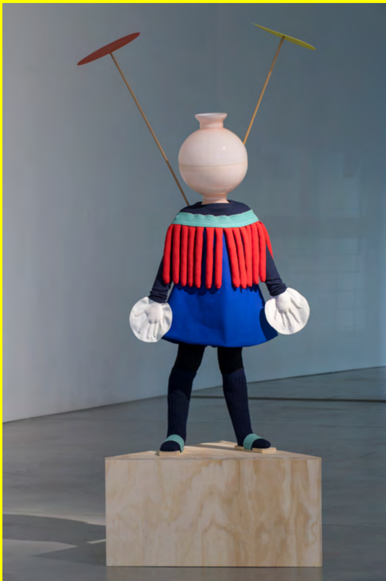
Virginie Barré, Simone , 2017 Résine, tissu. 150 x 65 x 25 cm Courtesy galerie Loevenbruck, Paris © Adagp, Paris, 2021 Photo Martin Argyroglo, courtesy Frac Bretagne