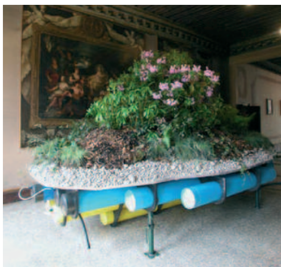
Simon Starling , Island for Weeds (prototype) , 2003

Lieu : Galeries du rez-de-chaussée Commissaire : Charlotte Laubard