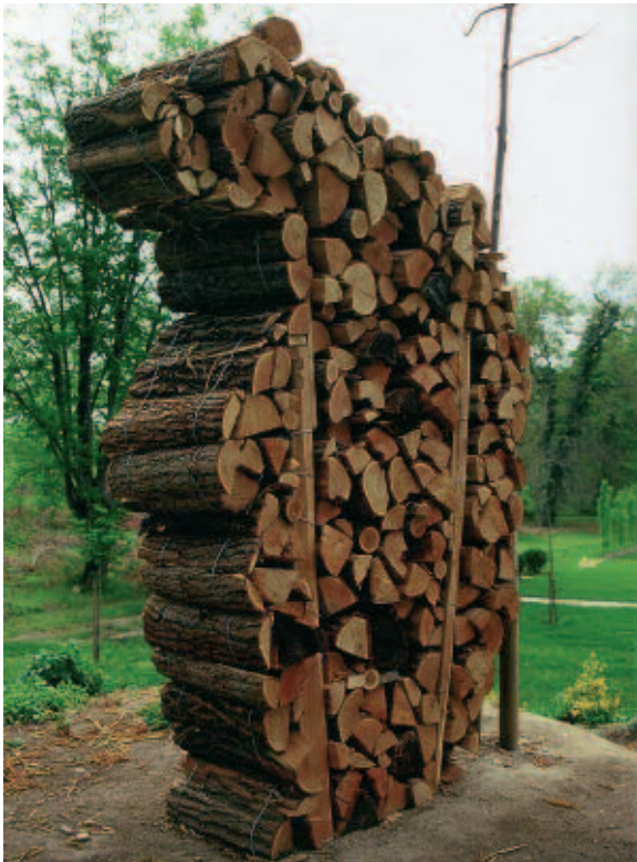
Laurent Le Deunff , Ours , 2006. Bois de chauffage, piquets de vigne, fil de fer, 160 x 230 x 50 cm.

Lieu : Terrasses du CAPC Commissaire : Charlotte Laubard