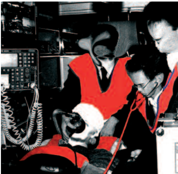
Diego Perrone, esquisse pour La mère de Boccioni en ambulance . (détail), 2007.