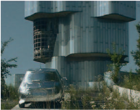
David Maljkovic, Scene for a new heritage , 2005

Lieu : Galeries du rez-de-chaussée Commissaire : Charlotte Laubard