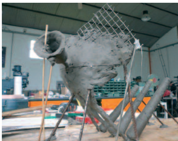
Diego Perrone, vue d'atelier, 2007.

Même si l'œuvre de l'artiste italien Diego Perrone (né en 1970 à Asti, vit à Berlin) a souvent été montrée dans le circuit des biennales internationales (Manifesta 2000, Venise 2003, Moscou 2005, Berlin 2006) et est présente dans des collections de musées telles que celles du Centre Pompidou ou du Guggenheim, elle demeure encore très peu connue du public. L'exposition de Bordeaux constitue sa première exposition personnelle en France et présente deux nouvelles sculptures et une vidéo dans un dispositif conçu spécifiquement pour la nef du CAPC.